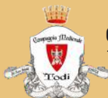
Compagnia Medievale Todi